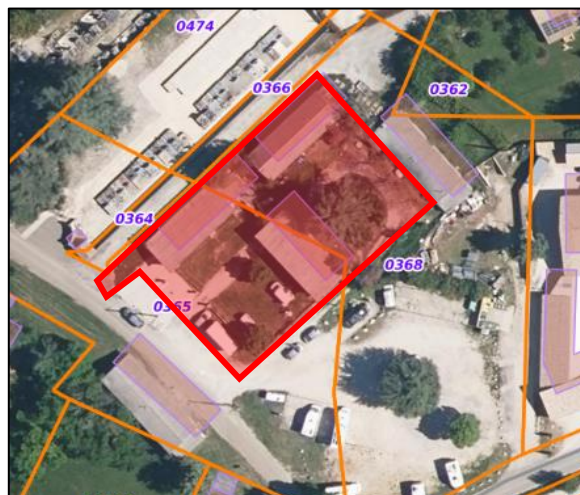
Délimitation de la zone projet

Le projet vise la création d'une structure métallique type hangar avec centrale photovoltaïque afin d'y positionner les Algeco des services techniques à l'intérieur. Le bâtiment permettra l'accueil des